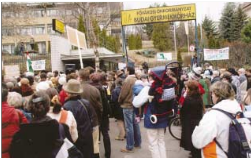
Összefogtak a Budai Gyermekkorházért: több százan gyűltek össze február 17-én az intézmény előtt, így tiltakoztak a gyermekkorház bezárása ellen

A Budai Gyermekkorház bezárását bíráló Péterfalvi Attila állásfoglalásában részletesen elemzi a szerinte átgondolatlan kapacitás-elosztások okozta helyzetet. Hangsúlyozza: az új beutalási rend szerint az eddig egy helyen elérhető, különösen magas színvonalú, illetve speciális ellátások szétszóródtak, csak a város különböző pontjain érhetőek el. A ki-