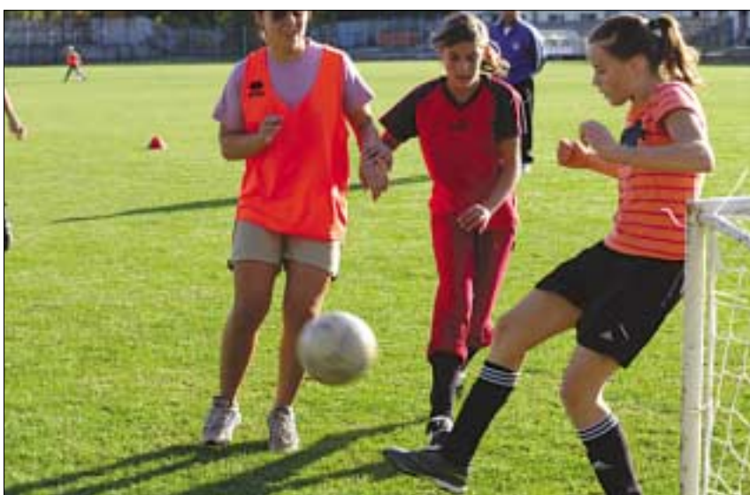
Egyre több lány rúgja a labdát a Kerület foci edzésein

Szeptembertől már nem csak a férfiak rúgják a labdát a III. Kerületi TUE Hévízi úti pályáin. A vezetőség úgy döntött, hogy a gyengébb nem képviselői részére is lehetővé teszik a népszerű játék űzését.