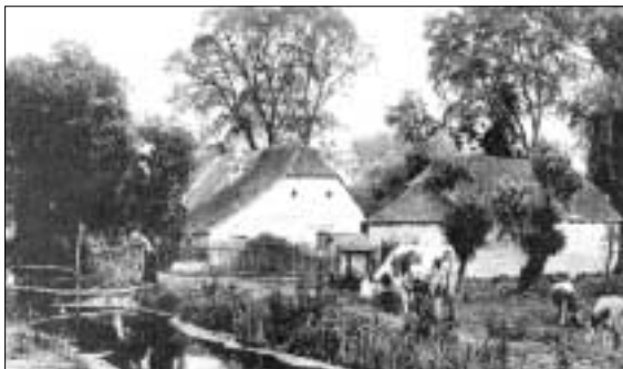
A Krempel-malom (1880-as évek)