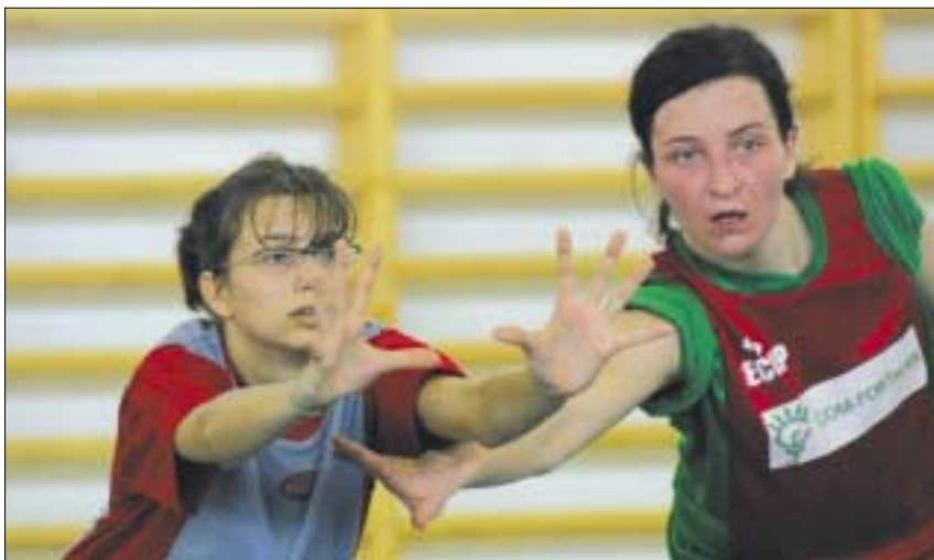
KORFBALL BÉKÁSMEGYEREN. A Veres Péter Gimnáziumban korfball edzéseket tartanak hétfőn és szerdán esténként. (Jelentkezés: obudakorf@freemail.hu vagy a 06-20-329-3238-as telefonszámon)

A III. Kerületi TUE Labdarúgó Szakosztálya állandó felvételt hirdet a sportágot szerető 6-14 éves gyerekeknek. Az utánpótlásnevelés egyik hazai fellegrárában füves pályák, szakképzett edzők és baráti légkör várja a jelentkezőket. (Érdeklődni lehet a TUE sportirodán, a 454-1260-as számon vagy személyesen, hétköznapokon 14-től 18 óráig a Hévízi úti pályán.)