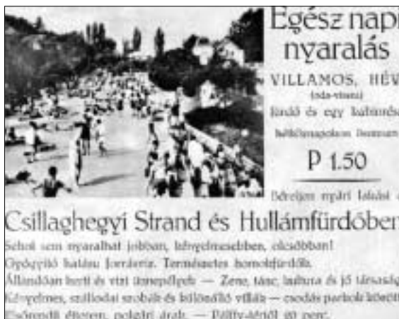
A Csillaghegyi Strand gyógyító hatású forrásvizének reklámja egy 1935-ben készült üdülési ajánlaton

úton a Frankl nevű pék építtetett egy malmot, mely mellett Malomkerekéhez céggel működött vendégfogadó. A Zum Radl fogadóról később a malom a Radl-malom nevet kapta.