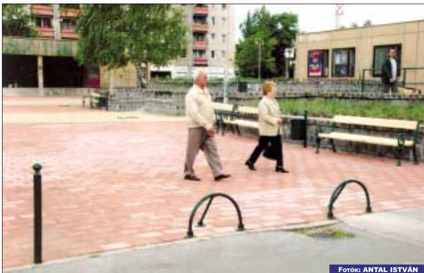
Részben pályázati pénzből újult meg a Pethe Ferenc tér

A Fővárosi Önkormányzattal való közös ügyekről szólva a polgármester elmondta, a kerületeket magukra hagyták, érdemi párbeszéd nincs, a döntés előkészítésbe nem vonják be a városrészeket. Semmi sem valósul meg a beígért Aquincumi Duna-hídból, még az építését sem kezdik el. A Szent Margit Kórházat január 1-jétől jogutód nélkül megszüntetik. A Római-parti gát