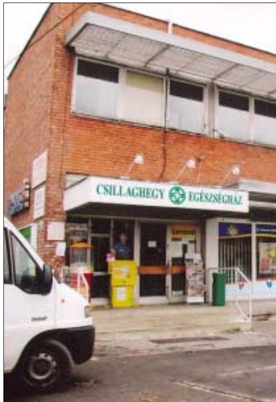
A Vasút sori Csillaghegyi Egészségház a prevenció óbudai zászlóshajója

hogy a BKV megszünteti az óbudai buszgarázst, s álláspontja szerint, ezzel összefüggésben jelentősen ritkítani fogják a járatokat. A Pünkösdfürdői strandot a több milliós felújítás