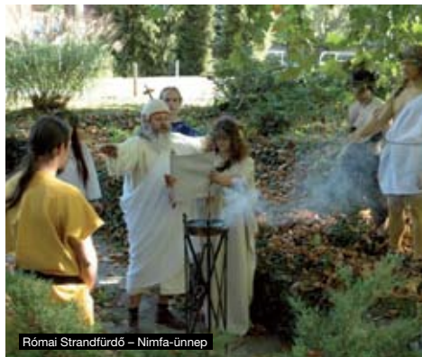
Római Strandfürdő – Nimfa-ünnep

(Bp. III., Laborc u. 2/C. Tel.: 06-70-548-9124, http://polaris.mcse.hu , polaris@mcse.hu , polaris.mcse.hu ) Fogadóidő, nyitva tartás: K, Sze, Cs, Szó: 18h-tól