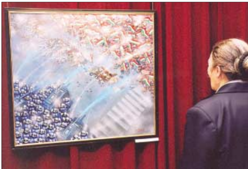
Galambos Tamás Munkácsy-díjas festőművész alkotásaiból nyílt tárlat az Óbudai Kulturális Központ San Marco Galériájában. A kiállítás március 29-ig, hétköznapokon 9-től 16 óráig látogatható. (Cím: San Marco utca 81.)

A helyi fenntartású Óbudai Múzeum és Könyvtár elsősorban helytörténeti kiállításairól ismert. Az „Óbuda - egy város három arca” című állandó kiállításon a városrész történetének három, egymástól jól elkülöníthető korszakát, a középkori Óbudát, a XVII-XIX. szá-