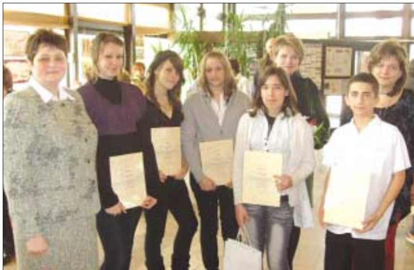
A rajzpályázat első helyezettjei

Nem véletlen ez a döntés, hiszen városrésznkben sok éves hagyománya van a két nép kapcsolatának. Óbuda-Békásmegyer évek óta testvérvárosa Varsó Bemowo kerületének. Diákjaink minden évben két hetet töltenek Lengyelországban e kapcsolat