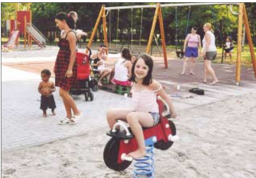
Új játszótér a Juhász Gyula utca 11-13. szám alatt

Husztí út elején épül, illetve készül el heteken belül összesen hét, korszerű, az uniós szabványoknak teljes mértékben megfelelő, biztonságos, modern játszótér.