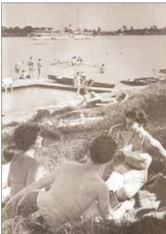
A Római-part a régi szép időkben.

egy új temetkezési mód: a csontvázas rítus, majd pedig a késő bronzkor második felében az úgynevezett urnamezős kultúra terjedt el. Számos, a helyi kultuszélethez szorosan kötődő tárgy miatt Budapest, sőt az egész Kárpát-medence kiemelkedő emléke a Királyok útján a múlt században feltárt késő bronzkori urnatemető . Az egyik sír urnájában 23 tárgyat találtak, amelyek feltételezhetően egy helyi sámán, varázsló eszközkészletét alkották. (www.aquincum.hu)