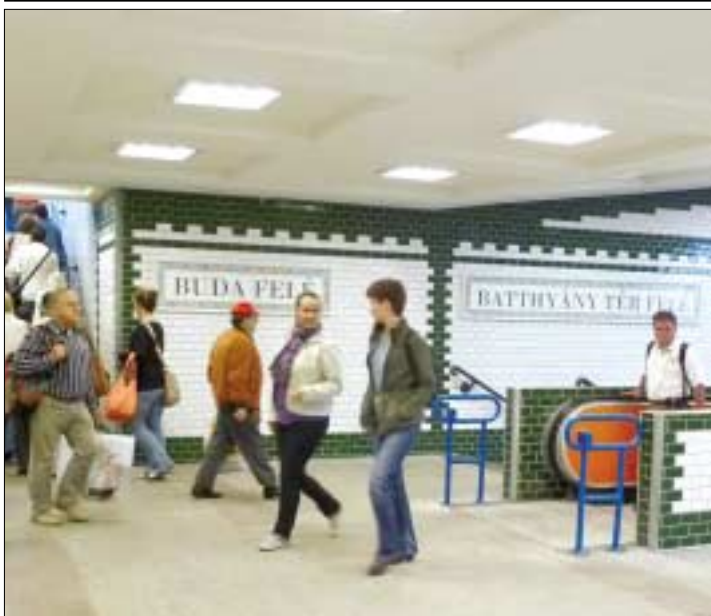
A Margit híd felújításához kapcsolódóan megújul az aluljáró is