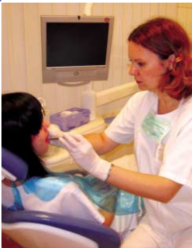
A rendelő korszerűen felszerelt SAJÁT FOGTECHNIKAI LABORRAL RENDELKEZIK, ezért RÖVID HATÁRIDŐVEL dolgozunk (fogbetegségtől függően)!