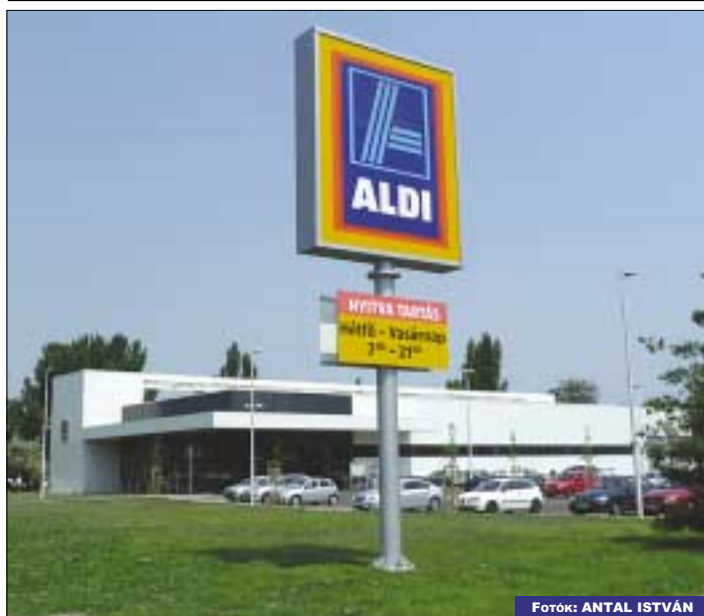
Aldi áruház nyílt a Szentendrei út mellett, a Ford Piramis helyén